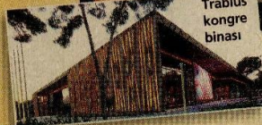
Trablus kongre binası

Yarışmaya en büyük mimarlık ofisleri katıldı. Ödül-